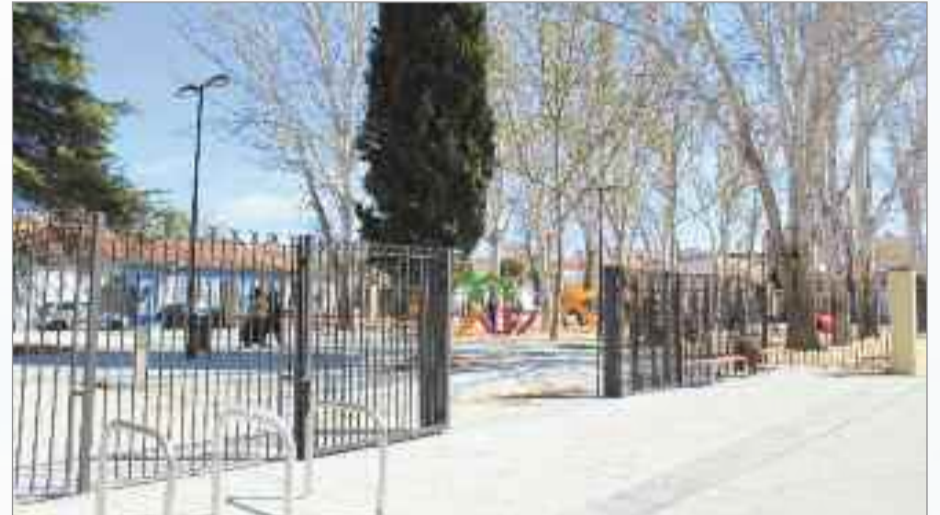
Remodelación del Parque Salvador de Madariaga. Este espacio es ahora un parque más seguro y accesible. Cuenta con nuevos juegos infantiles y con un área biosaludable para personas mayores. Inversión: 289.927,68 €