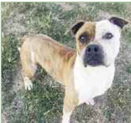
CYNTHIA - Edad: 25/02/2015 - Pitbull