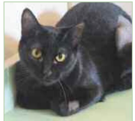
MOLLY - Es positiva a inmunodeficiencia felina