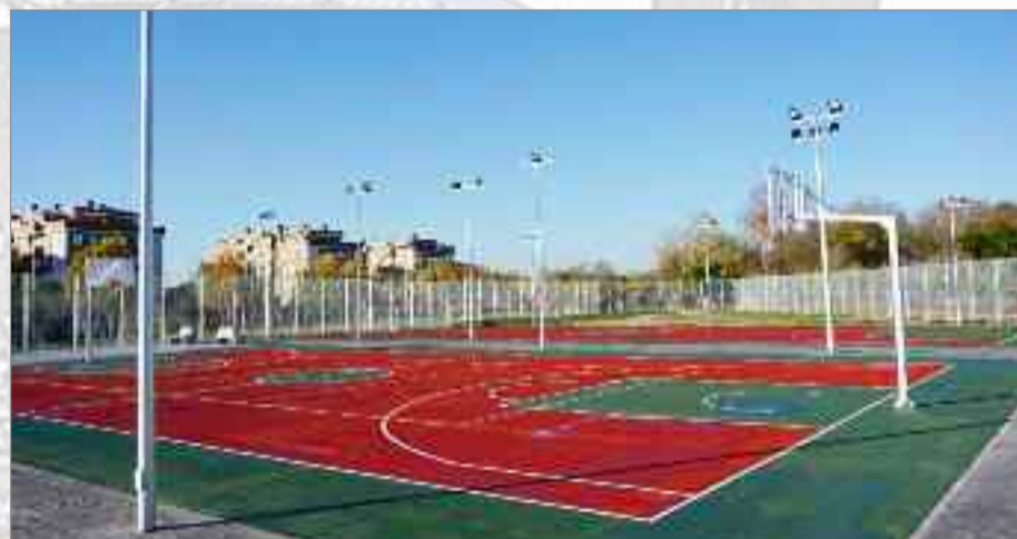
Nuevas Pistas Deportivas en Espartales. En la vía que une los barrios de Espartales Norte y Espartales Sur se han construido unas nuevas pistas deportivas al aire libre y de uso gratuito. Inversión: 289.768,90 €