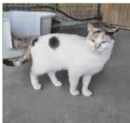
LIZZY - Edad: 2012 - Común Europeo