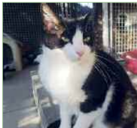
MANTIS - 2015 - Común Europeo