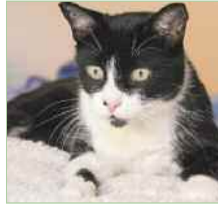
PINWI - Es positivo a inmunodeficiencia felina pero puede convivir con otros gatos