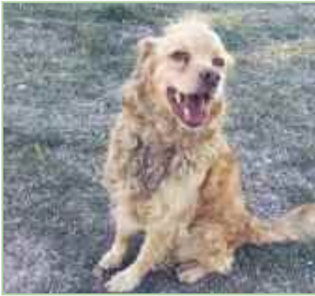
DRAK - 24/07/20019 Mestizo