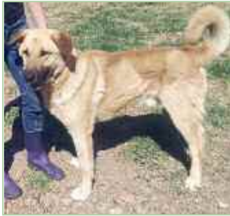
ATHOS - Edad: 27/08/2014 - Mestizo