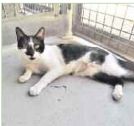
JULIA - 01/04/2018 - Común Europeo