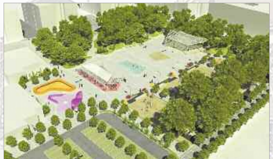
Proyecto antiguo Campo de Fútbol de Juan de Austria. El antiguo campo de fútbol de Juan de Austria se está convirtiendo en un gran parque en torno a una gran plaza a disposición de los vecinos y vecinas. También se están habilitando nuevas plazas de aparcamiento. Inversión: 1.749.485 €