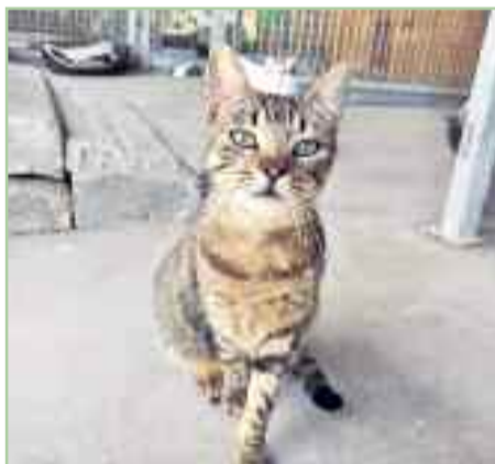
TIGRESA - 2017 - Común Europeo