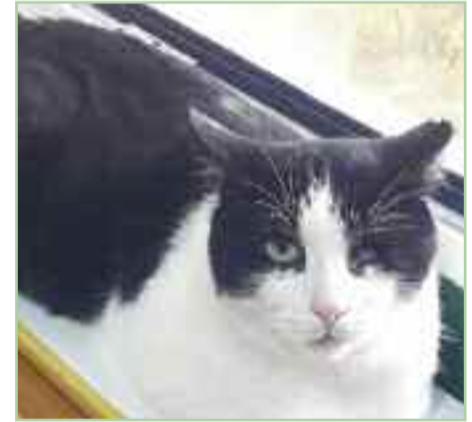
MOJITO - Es positivo a dos enfermedades felinas, la inmunodeficiencia y la leucemia felinas (las dos víricas y exclusivas de gatos).