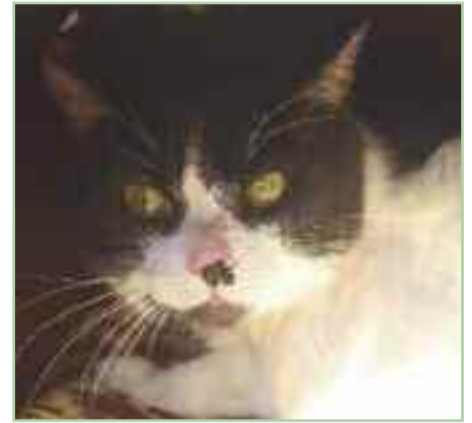
WILSON - Edad: dos años y medio