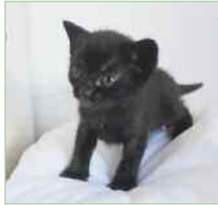
DROGON - Edad: 2 meses