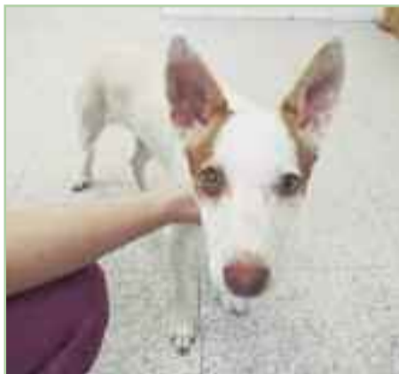
JUSTIN - 04/11/2018 - Podenco