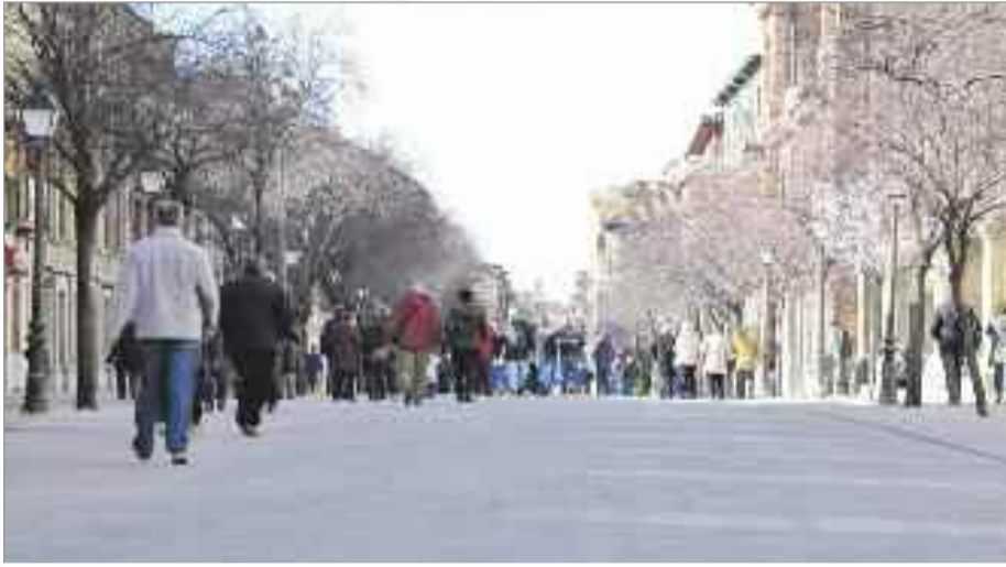
Remodelación de la Plaza de Cervantes y la calle Libreros. El objetivo ha sido convertir el casco histórico de una Ciudad Patrimonio de la Humanidad en un espacio más agradable y accesible para los vecinos, vecinas y visitantes. Inversión: 2.149.204,55 €

públicos, se han asfaltado numerosas calles, se han arreglado múltiples tramos de aceras, se han creado nuevos espacios deportivos, asimismo otros muchos otros proyectos están a punto de culminarse. Les ofrecemos en este reportaje algunas fotos de lo antes referido.