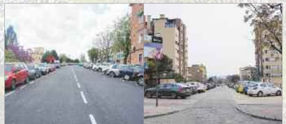
Primera Fase del Plan de Asfaltado, acerado y señalización. Se destinan 7,45 millones de euros y 1,1 millones de euros se dedican a trabajos de señalización y pintura. 25.000 toneladas de asfalto en 200.000 metros cuadrados de calles, 200 kilómetros de vías repintadas y 42 kilómetros de ciclocarriles.