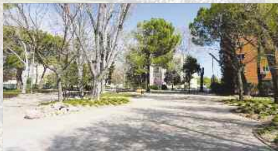
Parque de la Duquesa. Ubicado entre las calles San Vidal y Gardenia, este espacio se ha modernizado, se ha renovado el mobiliario urbano, se han llevado a cabo nuevas plantaciones y se ha habilitado un área canina. Inversión: 330.000,59 €.